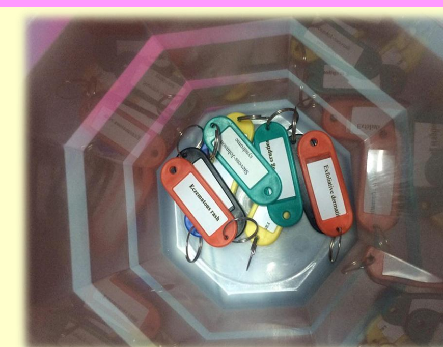
3. Drug Eruption Label (ฉลาก)