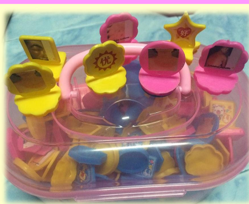
2. Drug Eruption Stamp (เบ๊ย)